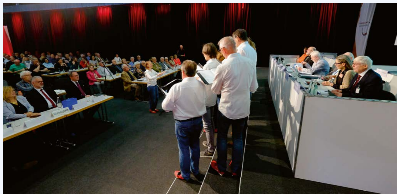
Der Xonx-Verein Altendorf sorgte für den musikalischen Einstieg in die Versammlung und erhielt großen Applaus.