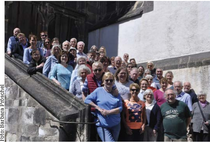
Der WRC vor der Peterskirche in Görlitz