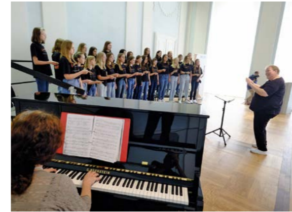
Impressionen vom Leistungssingen 2023.

Kein Wettbewerb, sondern eine individuelle Bewertung des eigenen Könnens ist das regelmäßige Leistungssingen, das der FSB in der Orangerie in Ansbach anbietet. In vier Leistungsstufen können Chöre sich das Prädikat „Leistungschor“ ersingen und dann für vier Jahre tragen, bevor man erneut vor die Jury tritt. In diesem Jahr nehmen 17 Chöre aus dem Bereich des FSB teil.