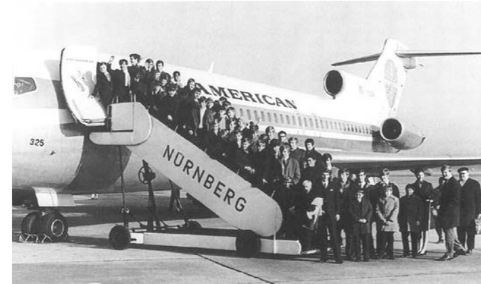
Im Jahr 1969 hoben die Windsbacher ab – es ging auf eine Reise nach Berlin

1946 bis in die Gegenwart und vereint alle Klangkörper zu einem eindrucksvollen Finale. Am 18. Oktober laden die Windsbacher zu einem großen Campusfest ein. Nach einem Festgottesdienst in St. Margareta Windsbach (10 Uhr) öffnet der Chorcampus seine Türen für alle Freunde und Wegbegleiter.