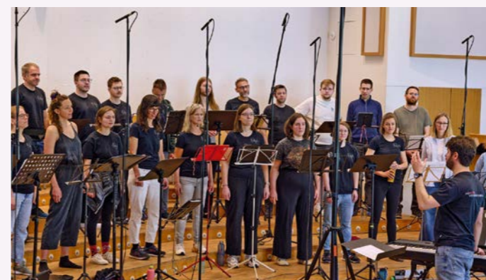
Die Mikrophone „hören mit“. Fokussierte Aufnahmeatmosphäre bei Sonoris