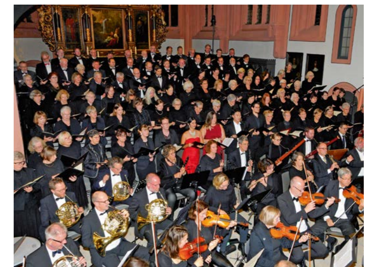
Der Philharmonische Chor Bayreuth

Die Konzertreihe begann mit der Aufführung des „Deutschen Requiems“ von Brahms im Festspielhaus. Darauf folgten die 9. Symphonie von Beethoven, das Verdi Requiem, „Die Jahreszeiten“ von Haydn, verschiedene Werke von Mendelssohn-Bartholdy und viele weitere große Werke namhafter Komponisten. Als Aufführungsstätten dienten die Bayreuther Stadtkirche, das Markgräfliche Opernhaus, das Evangelische Gemeindehaus und ab 1965 die Stadthalle Bayreuth. Jährlich gab der Philharmonische Chor Bayreuth zwei Konzerte, oft in Zusammenarbeit mit den Hofer Symphonikern.