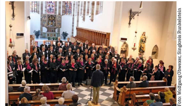
Beide Chöre gemeinsam in der Franziskanerkirche