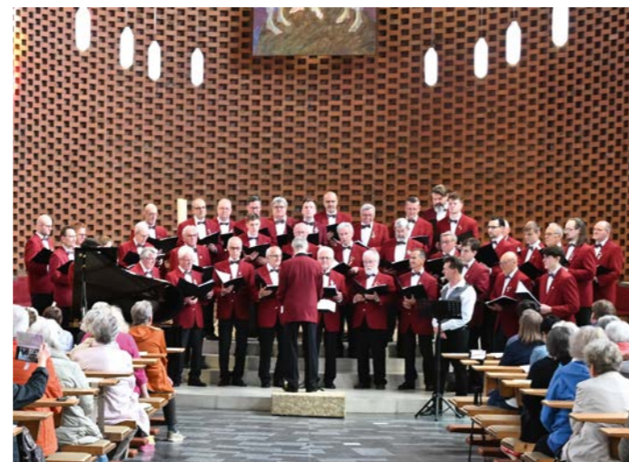
Der Männerchor Eintracht Reuth in der Kirche Verklärung Christi