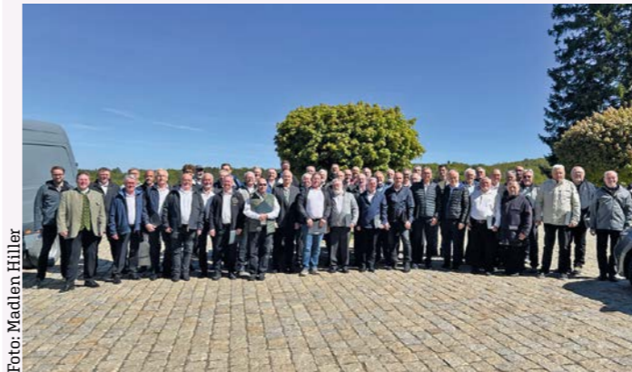
Projektchor des Männerchorseminars