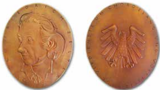
Die Vorder- und Rückseite der Zelterplakette

Bei Fragen rund um die Antragsstellung wenden Sie sich gern jederzeit an plaketten@bundesmusikverband.de /BMCO/