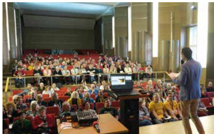
Der Musiksaal der Kongresshalle war gut gefüllt