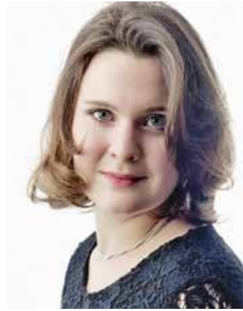
von Katharina Görtler

Durch das Sitzen (wohlge-merkt hinten an der Stuhlleh-ne!) unterbreche ich also ganz einfach und effektiv eben diese hinteren Spannungsketten in Rücken und Beinen. Das Becken kann nicht so leicht ins Hohlkreuz kippen und die