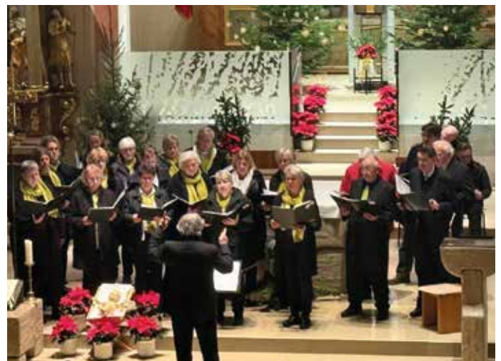
Die Chorgemeinschaft Schnaittach in St. Kunigund