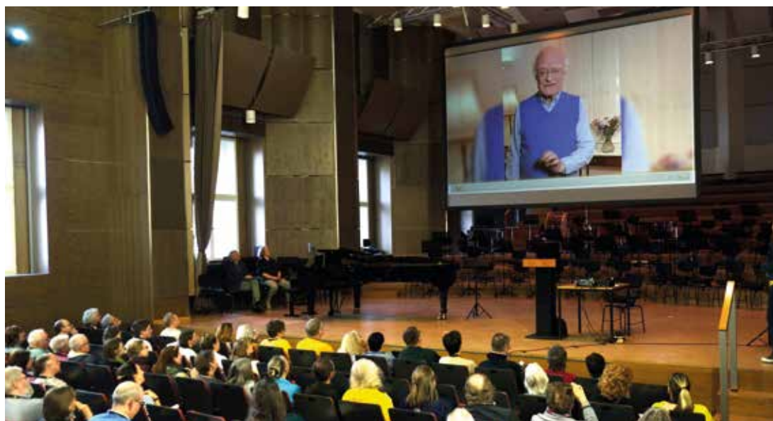
John Rutter grüßte per Videoeinspieler