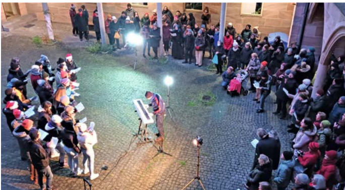
Das Adventssingen der Nürnberger Chöre im Jahr 2022.

Nachdem das Adventssingen im Krafft'schen Hof letztes Jahr so wundervoll weihnachtliche Atmosphäre auf dem Christkindles-