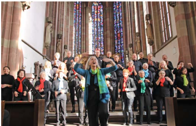
Einen furiosen Auftritt mit langanhaltendem Applaus der Zuhörer, präsentierten die Sängerinnen und Sänger des ‚Liederkranz Schwebenried‘ bei den 53. Würzburger Chormusiktagen in der Würzburger Marienkapelle am Marktplatz.