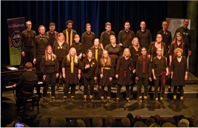
Würzburger Chormusiktage 2023 – Chorgala mit dem Chor ‚Die Socken‘ aus Nürnberg.