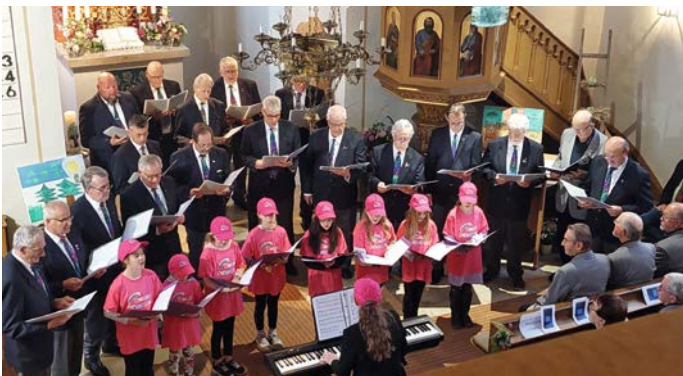
Gemeinsamer Auftritt: Der Männergesangsverein Germania und der Kinderchor „Bunte Stimmen“.

Vor vollem Haus und bei freiem Eintritt boten die Posaunenchöre aus Schwand bzw. Kiliansdorf, der Kinderchor „Bunte Stimmen“ und die Männerchöre MGV Germania Roth sowie die Liedertafel 1862 Schwand zwei bezaubernde Abendliederkonzerte. Die Bühnen von Schwand und Roth wurde belebt durch die kraftvollen Stimmen zweier herausragender Männerchöre, die unter der inspirierenden Leitung von Ingrid Mayer, eine herzliche Verbindung zwischen den Sängern und ihrem Publikum eingingen. Ein Highlight des Abends war die Premiere des Kinderchors „Bunte Stimmen“, der sich aus