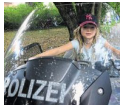
Mal auf einem echten Polizeimotorrad sitzen.