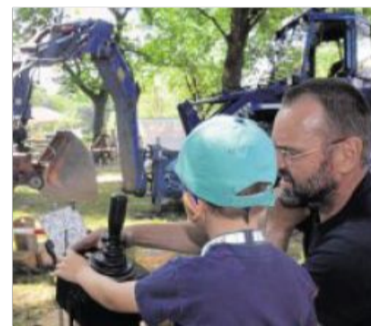
Kinderleicht: Riesenschaukeln eines Radladers lassen sich per Joystick beim THW mit den Fingern steuern.