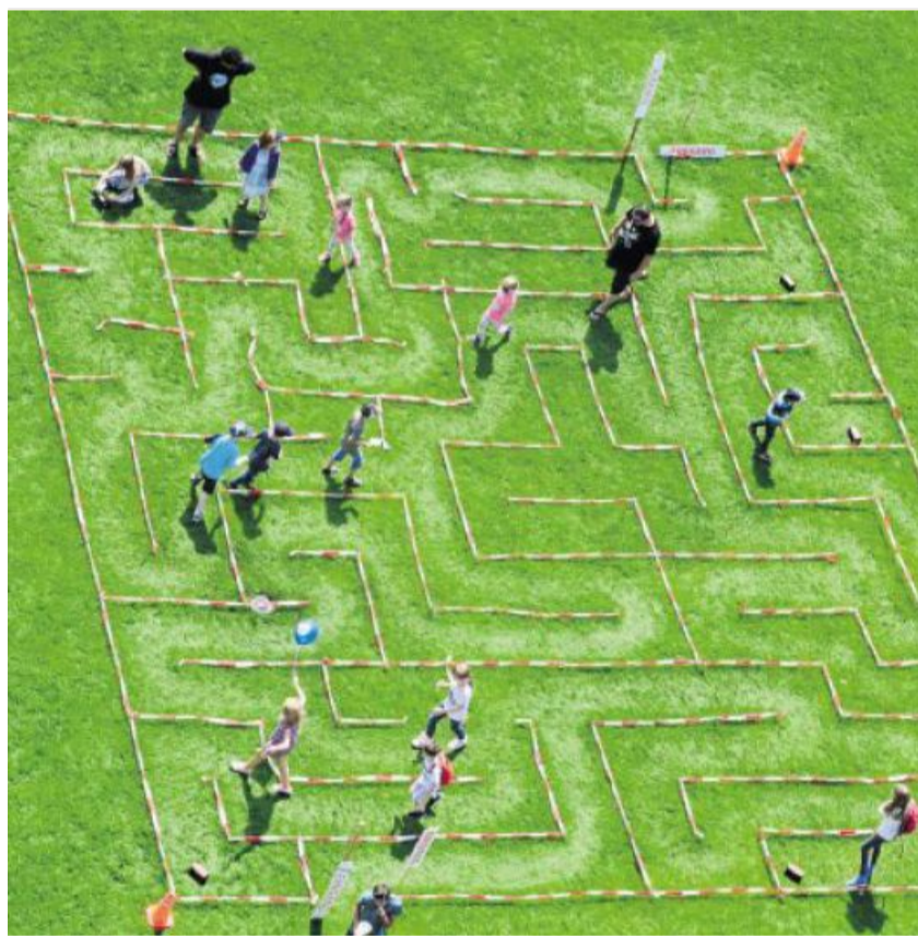
Im Riesenlabyrinth geht es auf Schatzsuche.

Im Mittelpunkt standen die Kinder. 81 Vereine, Jugendgruppen und Verbände sorgten zwischen Realschule und Friedrich-Ebert-Straße für deren Wohl und Spaß. Egal, ob im Riesenla-