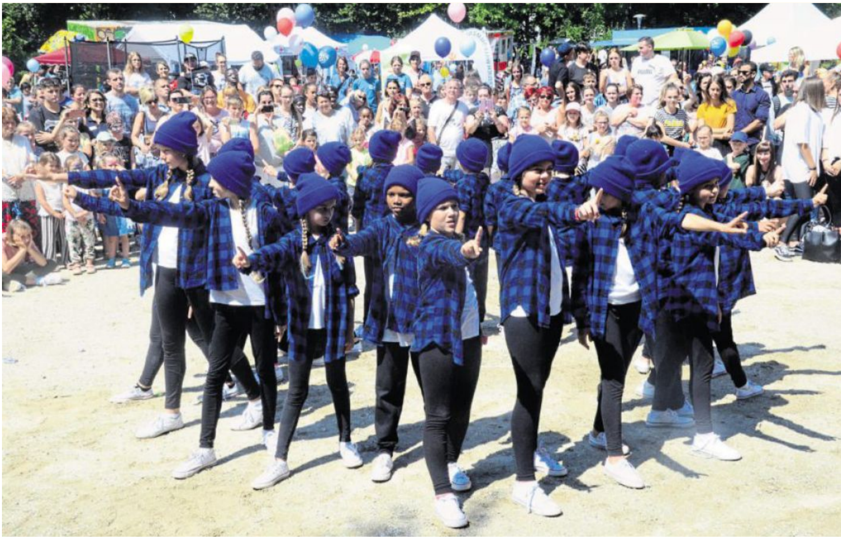
Die „Dance Kids“ der SpVgg SV Weiden präsentieren sich in Blau.