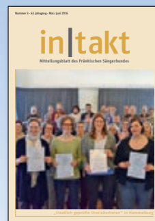
in|takt 3 „Staatlich geprüfte Chorleiterinnen“ in Hammelburg