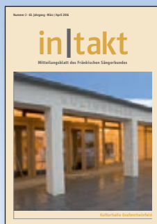
in|takt 2 Kulturhalle Grafenrheinfeld