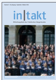
in|takt 5 „Frankenhymne“ beschließt Festkonzert im Staatsbad