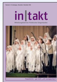
in|takt 6 Poppsternla – gar nicht „voll laaangweilig“!!