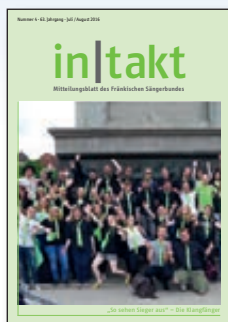
in|takt 4 „So sehen Sieger aus“ – Die Klangfänger