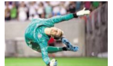
Bayern-Torwart Manuel Neuer.

Der FC Bayern hat auf seiner USA-Reise nach einer ansehnlichen Vorstellung einen Prestigeerfolg gegen Real Madrid gefeiert. Der Rekordmeister siegte in Houston 3:1. Der 1. FC Nürnberg spielte 1:1 gegen Paris St. Germain.